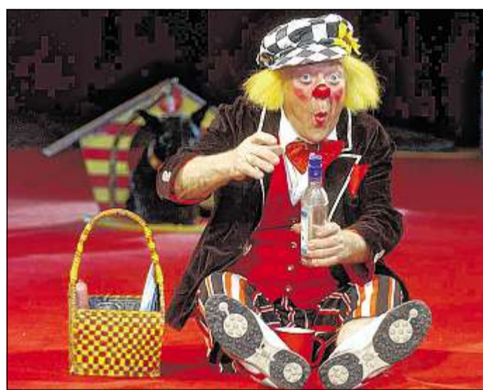
Mit der Clown-Legende Oleg Popov gastiert der Russische Staatszirkus ab Donnerstag in Baden-Baden.

Wenn die Putzfrauen Babett und Judith das Publikum begleiten, dann darf man sich auf eine saubere Führung im Schloss Favorite bei Rastatt freuen. Beginn am Samstag, 2. April,