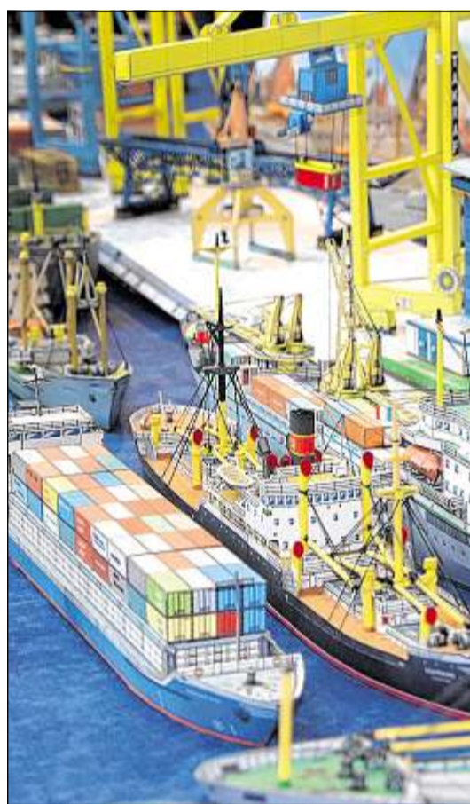
Schiffsmodelle aus Karton werden wie vieles Weitere auf der Modellbaumesse in Karlsruhe präsentiert. Die Schau ist von 9 bis 17 Uhr in drei Hallen der Messe Karlsruhe zu sehen.