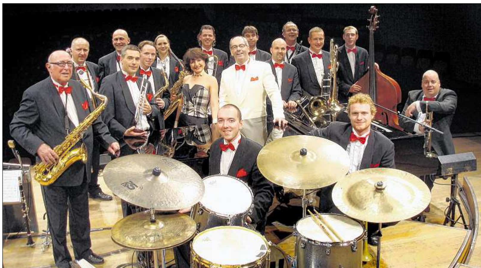
Diese Musiker pflegen den Big-Band-Swing im Stil von Glenn Miller und sind weltweit auf Tournee: Das Glenn Miller Orchestra gastiert am Freitag, 1. April, in der Stadthalle Ettlingen.

Glenn Miller Orchestra, Freitag, 1. April, 20 Uhr, Stadthalle Ettlingen, Friedrichstraße. Vorverkauf: Stadtinformation im Schloss Telefon (0 72 43) 1 01-2 21 oder 1 01-3 80.