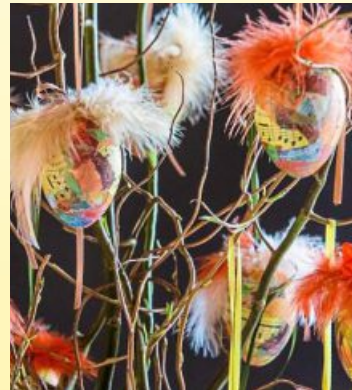
Bemalte Ostereier dürfen hier natürlich nicht fehlen.

Dekoration und Nützlichem für das ganze Jahr. Egal, ob es um dekorative Kränze oder bunt bemalte Ostereier geht, hier werden große und kleine Besucher gleichermaßen fündig. Kunstvolle Scherenschnitte und Karten für jeden Anlass findet man hier ebenso wie bunte Servietten und spannende Bücher. Kunstvolle Holzarbeiten, vielseitige Töpferwaren und vieles mehr wird hier angeboten. Puppenkleider, Schals sowie besondere Accessoires aus Leder und anderen Materialien sind auf dem Ostermarkt ebenfalls zu haben. Und natürlich finden auch die Schmuckliebhaber hier wieder eine große Auswahl an Schätzen.