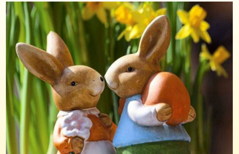
Auf dem Brettener Ostermarkt sorgen zahlreiche Aussteller für eine besondere Auswahl an Angeboten und Geschenkideen.

Während des Einkaufsbummels auf dem Ostermarkt muss auch mal etwas Zeit für eine gemütliche Pause sein. Für die passende Pflege vor Ort sorgt in diesem Jahr die Johann-Peter-Hebel Gemeinschaftsschule an: Am Stand werden heißer Kaffee und leckere Kuchen angeboten. Eine Freude